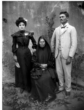
Fotografía Jacinto Alonso

Organizan Cabildo de Lanzarote y Ayuntamiento de Yaiza. Colabora Galería Artizar